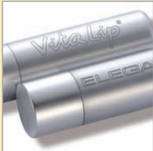
Edle Lasergravur auf Kappe oder Sockel