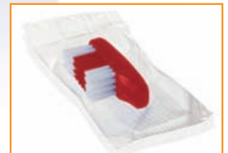
Bürstenkopf einzeln in Folie eingeschiegelt