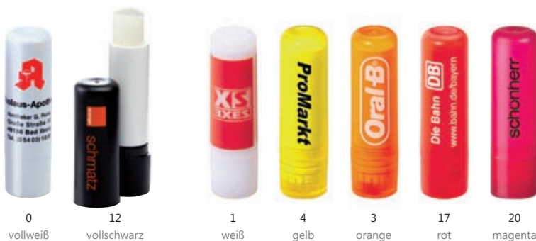
0 vollweiß 12 vollschwarz 1 weiß 4 gelb 3 orange 17 rot 20 magenta