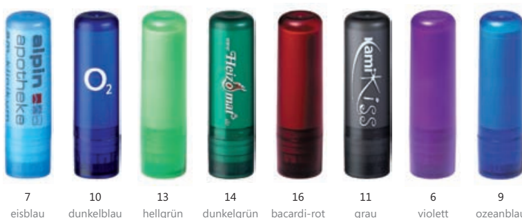
7 eisblau 10 dunkelblau 13 hellgrün 14 dunkelgrün 16 bacardi-rot 11 grau 6 violett 9 ozeanblau